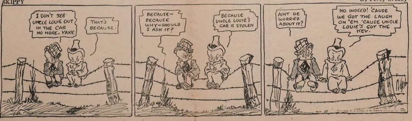
By Percy Crosby