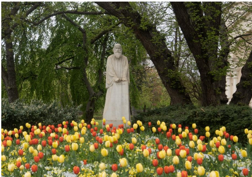
Denkmal in Laibach, gefertigt von dem Bildhauer Franz Bernecker 1910. Trubar wird bei einer Predigt hinter einem Pult dargestellt. © D. Horvat

Seine Liebe zum slowenischen Volk zeigte Trubar durch sein literarisches Programm und durch die Inbrunst eines Predigers, die sich auch in seinen herzlichen Anreden zeigt: „Liebe Slowenen“, „Meine lieben Slowenen“, „Meine lieben Brüder“, „Meine lieben slowenischen Brüder.“ Trubar gilt als führender slowenischer Reformator, Vorreiter der slowenischen Literatur und Begründer der slowenischen Schriftsprache. Bis zu seinem Lebensende setzte er sich für die slowenische evangelische Kirche, für Bildung und Schule, für das slowenische Wort in gedruckter Form ein. Er bereitete rund 30 Bücher in slowenischer Sprache vor, darunter die Übersetzung des gesamten Neuen Testaments im Jahr 1582. Sein letztes Werk war die Übersetzung von Luthers „Hauspostille“, die neun Jahre nach seinem Tod von seinem Sohn Felician veröffentlicht wurde.