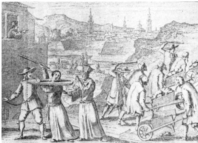
Folter slowenischer Protestanten

Die Rekatholisierung der slowenischen Länder begann 1598, als Ferdinand II., der Erzherzog von Innerösterreich, das Augsburger Prinzip des Religionsfriedens „wessen Land, dessen Glaube“ durchzusetzen begann und die Protestanten vertrieb. Um eine innere Erneuerung der Kirche herbeizuführen, verbot er alle evangelischen Gottesdienste in den Städten und auf den Plätzen, vertrieb die protestantischen Prediger aus dem slowenischen Gebiet und befahl dem Bürgertum und dem Adel, sich dem katholischen Glauben anzuschließen. Ein größerer Erfolg wurde durch die Arbeit der Reformationskommissionen erzielt, die sich als Untersuchungs- und Exekutivorgan unter der Leitung von Ortsbischöfen und Vertretern der Kirche und des Militärs etablierten.