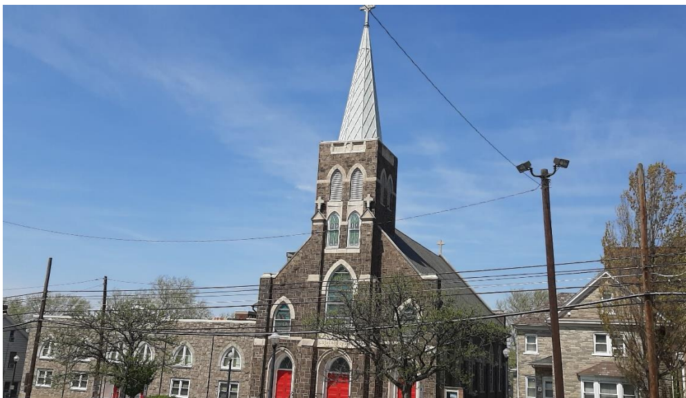
Die Kirche St. Johannes in Bethlehem

Diese Zeitungen, die eine entscheidende Rolle bei der Bewahrung der Sprache und des slowenischen Nationalbewusstseins unter den ausgewanderten Landsleuten von Prekmurje und Porabje spielten, sind noch heute eine der wichtigsten Quellen über das Leben der Slowenen von Prekmurje und Porabje in Amerika in der ersten Hälfte des 20. Jahrhunderts sowie für die Geschichte der Evangelischen Kirche in Slowenien.